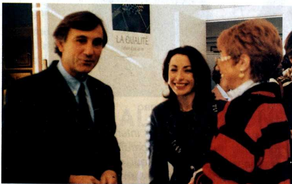
Des avocats appréciés au profil trop rare

famille (...) vous pouvez compter sur mon soutien pour faire évoluer dans ce pays un peu plus l'égalité entre la maman et le papa. En aucun cas, je le dis ici, je ne souhaite qu'il faille donner plus à l'un qu'à l'autre, jamais! Mais je trouve que donner systématiquement, automatiquement, la responsabilité de l'enfant à la maman, ce n'est pas possible. Et que cette maman perde beaucoup de temps à essayer de mettre dans la tête de son enfant qu'il ne doit pas voir son papa parce que ce n'est pas un bon papa, cela est indigne et je ne peux pas être de ce côté des choses.