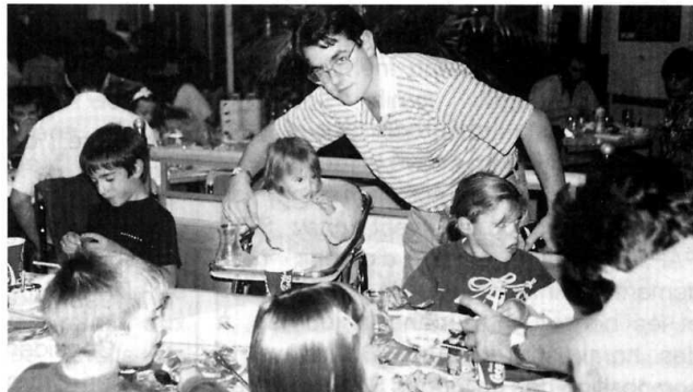
Un papa-président attentif à tous

Exceptionnellement, la dernière réunion mensuelle de l'Association SOS PAPA TOURAINE s'est déroulée hors de Tours, plus précisément au Café de l'Agriculture, avenue Monory à Blois... Deux des six membres du bureau vivant à proximité de cette ville.